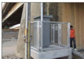
ภาพการติดตั้งสถานี