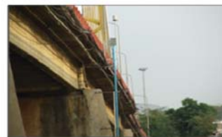
ภาพการติดตั้งอุปกรณ์