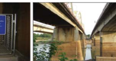
ภาพการติดตั้งอุปกรณ์