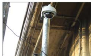
ภาพการติดตั้งกล้อง